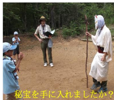
秘宝を手に入れましたか？