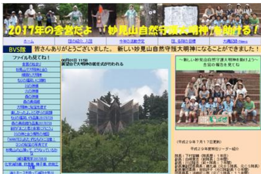
豊中第2団のHP（8月1日）から引用

一般の人の参加を前提としたイベントでも、活動の参加をアピールするちらしやポスターだけでなく、HPで情報を提供することをやってみたい。1か月前からシナリオスクリプトを考えて、事実と創作を組み合わせ、おもしろい説明とすることを広めたい。ボーイスカウトの活動はおもしろいのだ。真におもしろさを掲載して、ボーイスカウトの良さを理解していただくことを目指している。