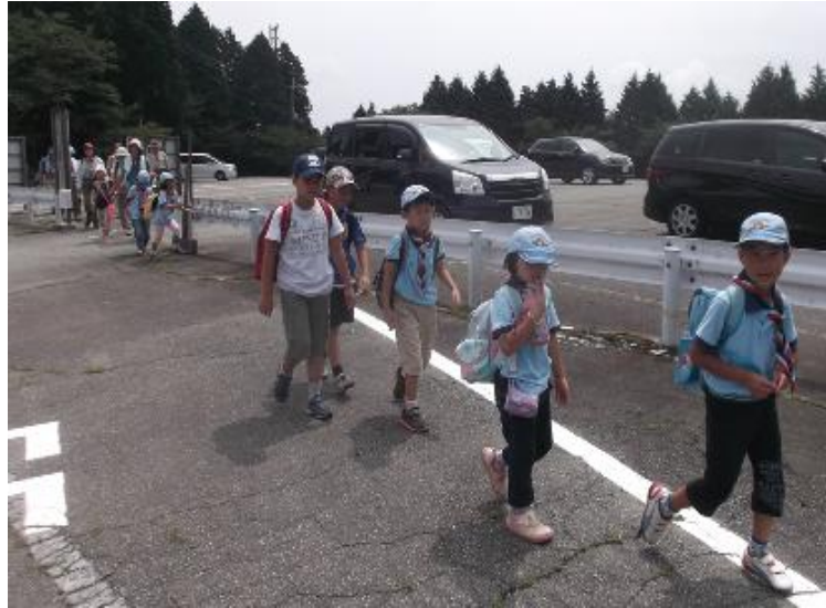
豊中第2団のHP（7月31日）から引用

スカウトや保護者は、車から降りると周りの景色に見とれていた。大明神のお陰で、ここまで来ることができたのは、ラッキーだった。