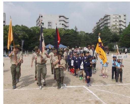
合同運動会の2連覇は、感動を共有