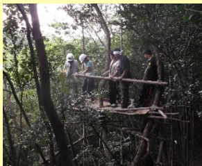
ボーイ隊の キャンプ場のツリーハウス