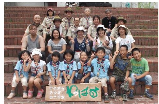
ビーバー隊の舎営、楽しい顔がいっぱい