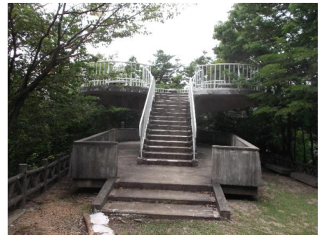
この展望台で何かが起きるぞ！