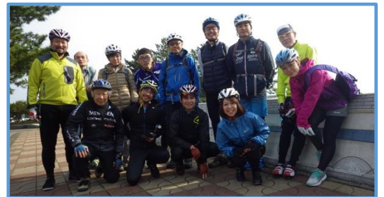
2015年第1回体力測定会

※会員以外の参加者で自転車保険に加入されていない方は、『TSマーク自転車向け保険』に加入してください。サイクルショップ銀輪亭でも、自転車整備と加入が出来ます。